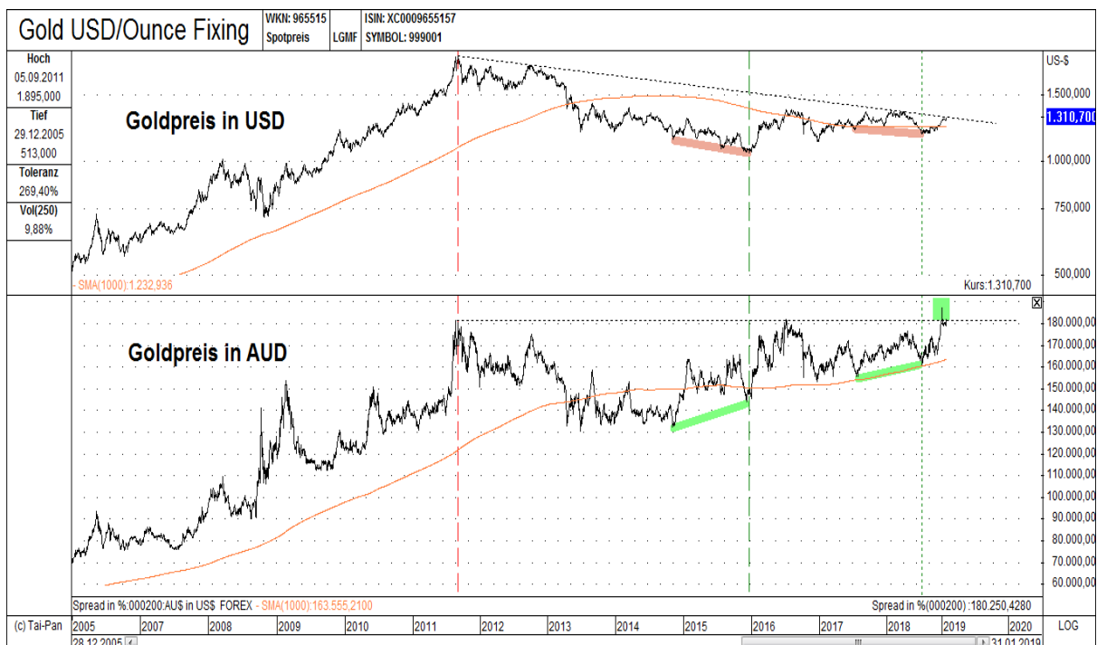
Abb. 1: Goldpreis in USD (oben) versus Goldpreis in AUD (unten) von 12/2005 bis 01/2019

Unbeachtet vom breiten Publikum, notierte der Goldpreis im vergangenen Monat in 72 von weltweit 162 Papierwährungen bereits wieder über seinem alten Allzeithoch aus dem Jahr 2011. Der Goldpreis in AUD (Australische Dollar) gehörte ebenfalls hier dazu (siehe hierzu das grüne Rechteck im unteren Teil von Abbildung 1). Dem kurzfristigen Gold-Tradingtieft im August 2018 ging, wie dem mittelfristigen Gold-Taktiktief im Dezember 2015, eine positive Divergenz des Goldpreises in AUD – als Vorlaufindikation – voraus (siehe hierzu die beiden grünen Balken im unteren Teil von Abbildung 1). Während sich an beiden Tiefpunkten die negativen Expertenmeinungen zum Thema Gold überschlugen, wiesen wir beides Mal explizit auf die einmalige Kaufgelegenheit im Goldsektor hin (siehe hierzu: Historische Extremdaten im Goldsektor signalisieren signifikantes Tief ). Das neue Allzeit-Hoch beim Goldpreis in AUD impliziert – im Rahmen seiner Vorlaufindikation – in nicht allzu ferner Zukunft zwangsweise auch ein neues Allzeit-Hoch beim Goldpreis in USD (inkl. in EUR)!