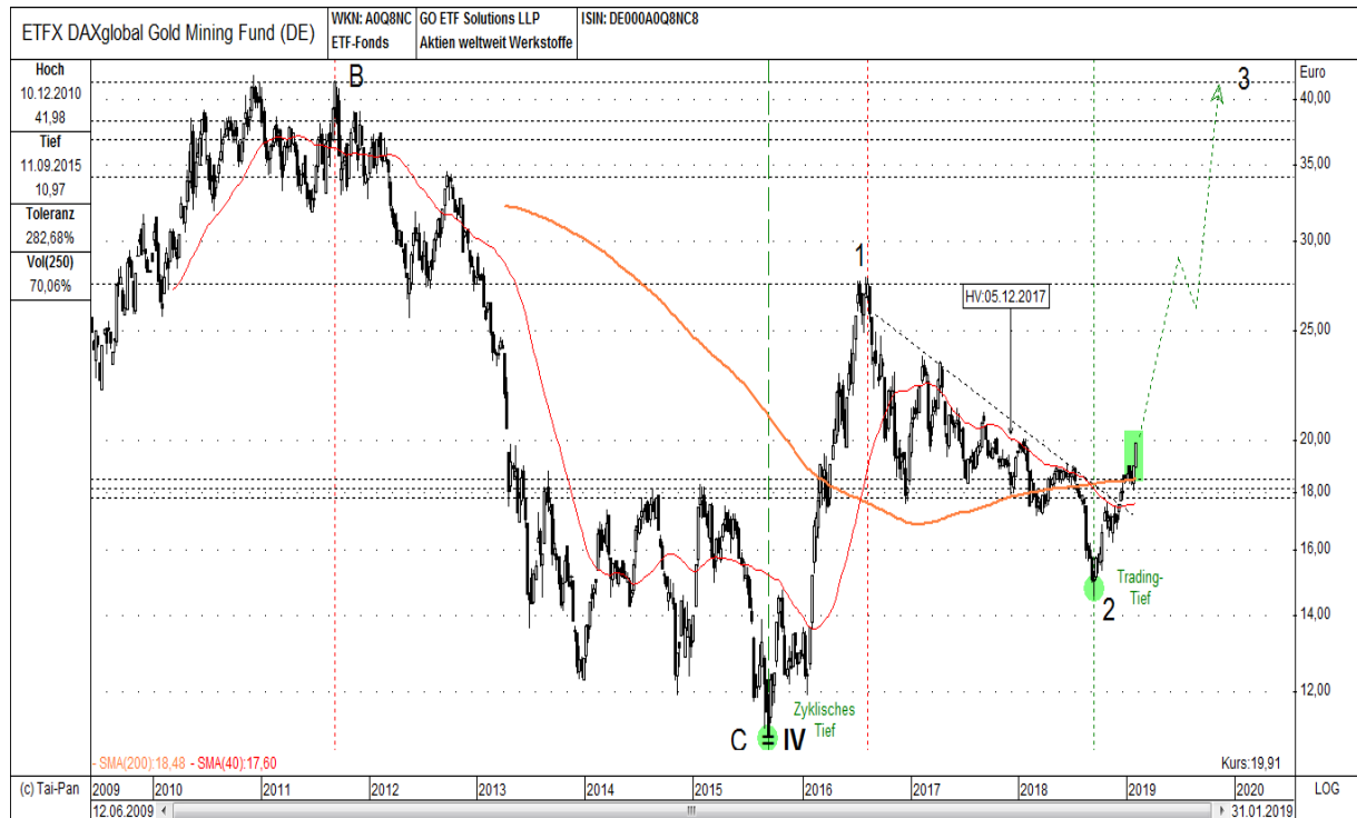
Abb. 3: DAX Global Gold Mining ETF in EUR von 06/2009 bis 01/2019

Auch der DAX Global Gold Mining ETF in EUR bestätigt, mit seinem prozyklischen Kaufsignal im Januar, die Vorlausindikation des australischen Goldsektors. Deshalb sollte der gesamte Goldminen-Sektor, innerhalb der kommenden 12 bis 18 Monate, sein altes Allzeithoch aus dem Jahr 2011 wieder erreicht oder sogar überschritten haben. Der Goldpreis in AUD dient hier als „Routenplaner“!